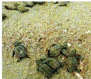
Μικρά νεογέννητα Καρέττα-Καρέττα